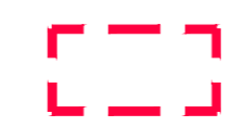
AREA DI INTERVENTO